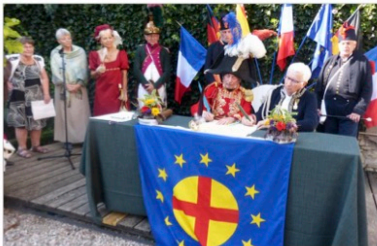
L'événement historique relaté : le traité de paix franco autrichien de 1801.

La cérémonie ne se borna donc pas à l'évocation d'un événement historique, mais se poursuivit par la signature de « la nouvelle paix de Lunéville », un document symboli-